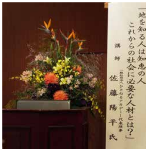
ph-2 演題「地を知る人は知識の人 これからの社会に必要な人材とは？」