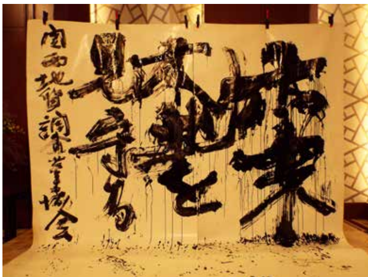
ph-26 壇上の作品 「未来 大地を見守る 関西地質調査業協会」