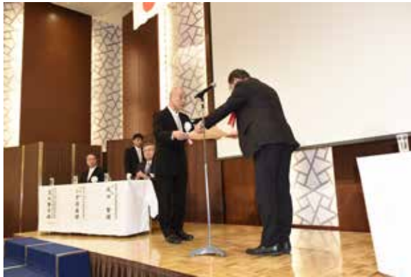
Ph-10 国土交通省感謝状拝受