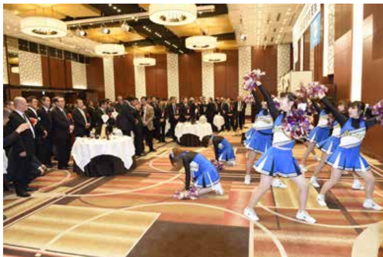
ph-29 チアリーディング会場風景