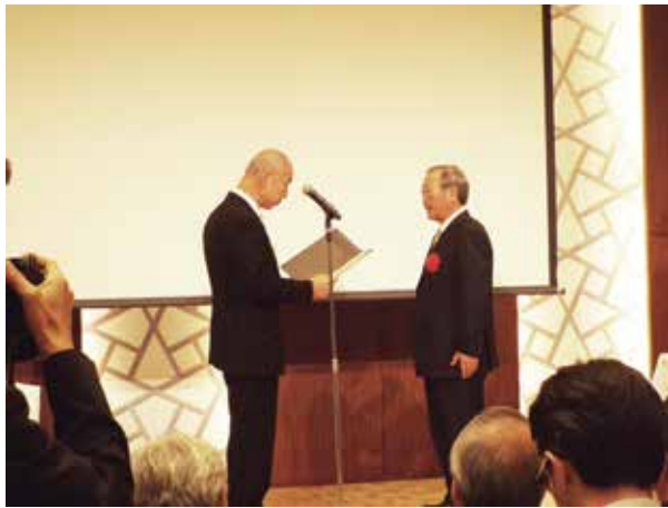
Ph-12 表彰状・記念品授与