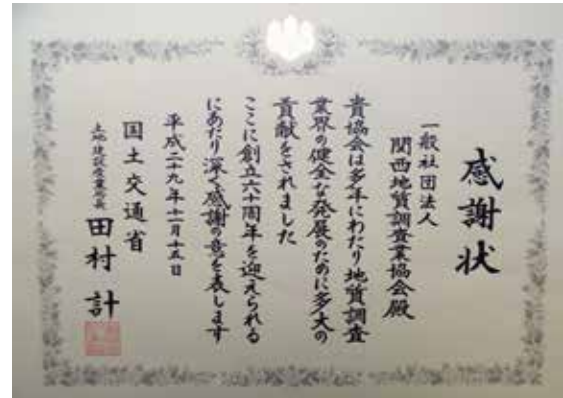
Ph-11 国土交通省感謝状