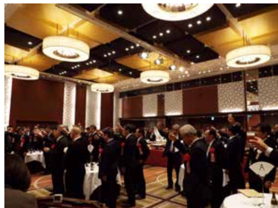
ph-21 乾杯発声会場風景