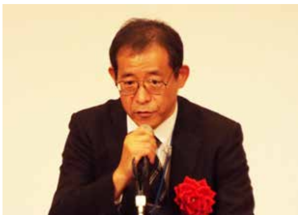
ph-8 来賓祝辞 国土交通省土地・建設産業局 建設市場整備課長補佐 吉川 文義 様