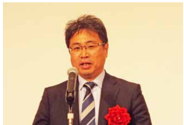
ph-9 来賓祝辞 国土交通省近畿地方整備局企画部長 井上 智夫 様