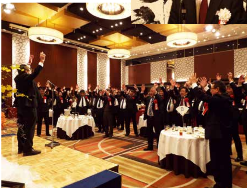
ph-31 万歳三唱会場風景