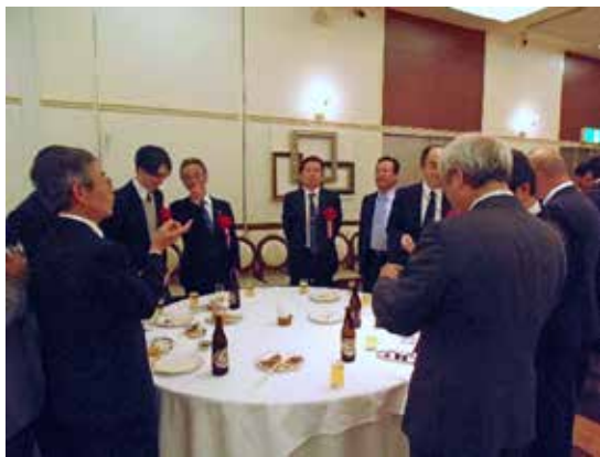
Ph-4 ご臨席賜った来賓の方々